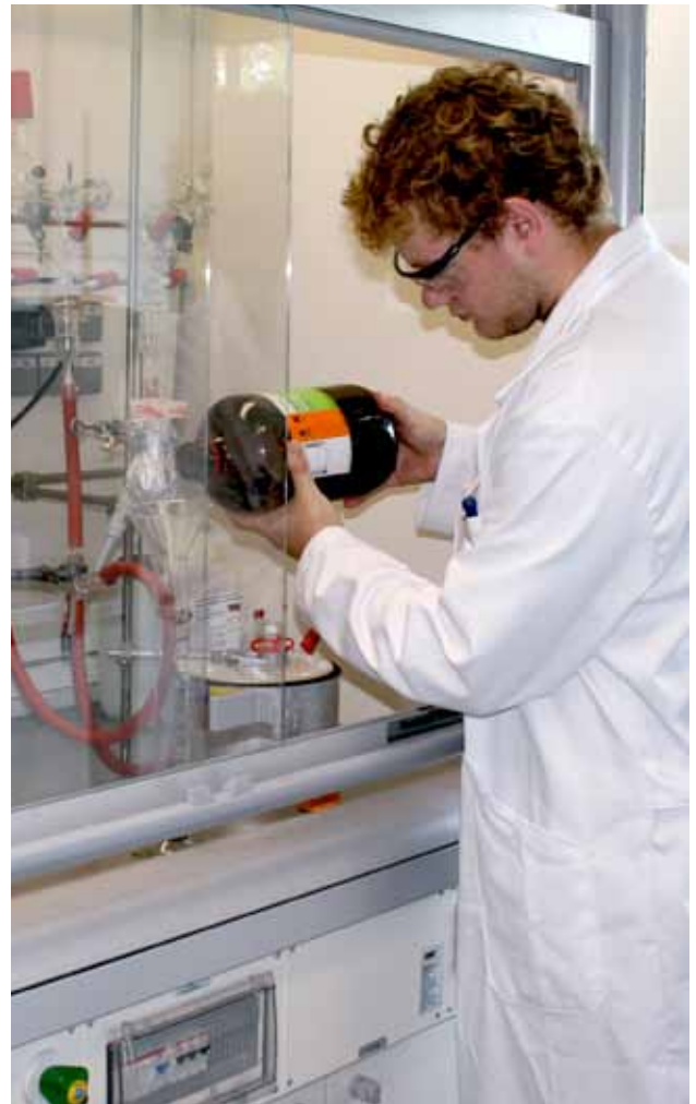
Doktorand des LOEWE-Schwerpunkts Soft Control an der TU Darmstadt bei der Synthese schaltbarer Polymere im Labor.